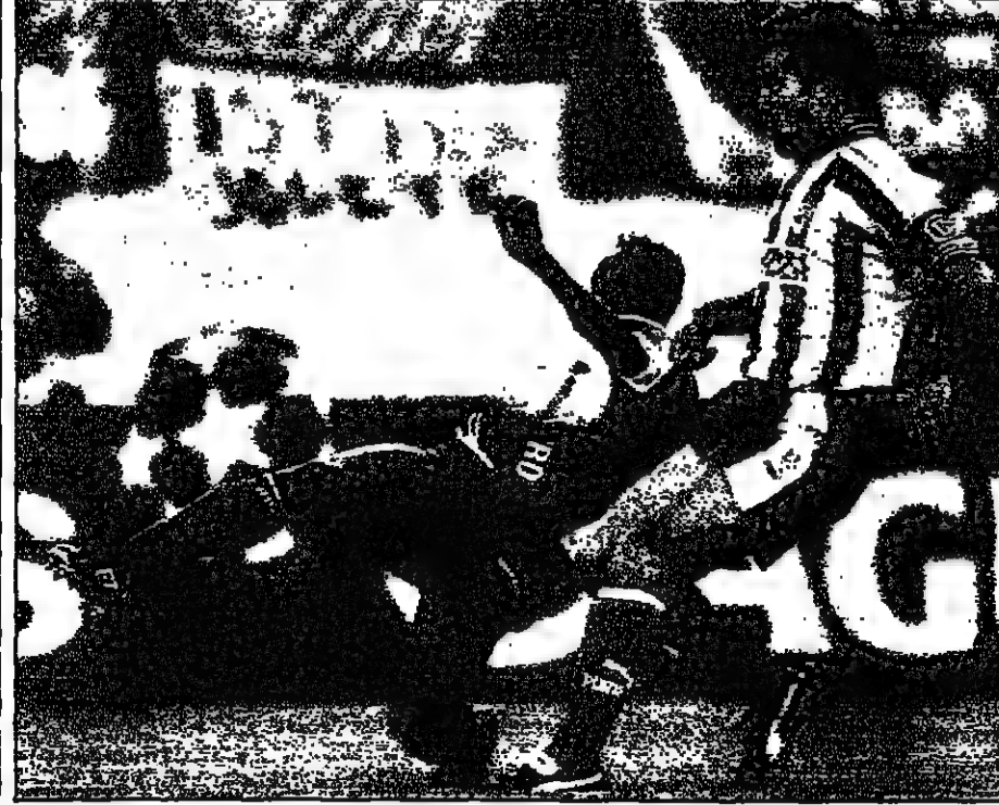
الجزيري تيجان بايا نجيبا لاعب اياكس في المباراة الفوز بالكرة

سان بطرسبورغ (روسيا) - ألب بد وقع الالبي ديفيد بريونوسيل الهولندي صفر-صفر في المباراة الاولى من دورة سان بطرسبورغ الروسية الدولية لكرة الضرب عبر اشراف امير السويدي ماتسوس توماس 6-4 وفي الدور الاول، فاز النشارتي كينيث كارلسن الثمانين على الاسباني